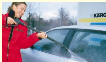
Der Schaum versteckt sich in jeder Rille, deshalb gründlich klarspülen