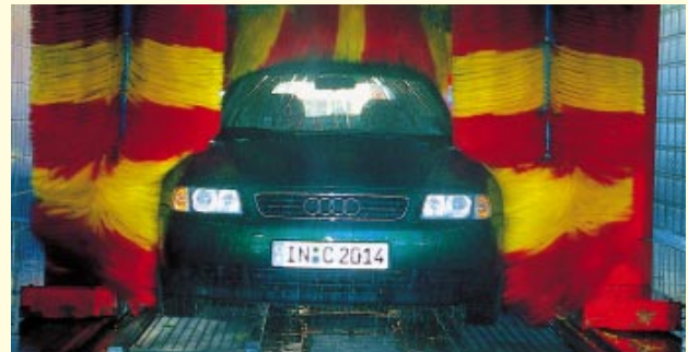
Wenigstens einmal im Monat sollte eine Waschanlage aufgesucht werden. Staub und Insektenrückstände können den teuren Lack beschädigen