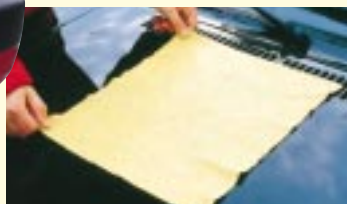
Nach dem Trocknen die letzten Wassertropfen mit einem Ledertuch entfernen