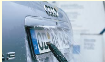
Bei der Hochdruckwäsche die unzugänglichen Stellen nicht vergessen